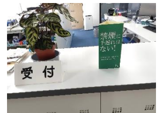
← ポスター掲示や受付で禁煙・受動喫煙防止の啓発をしている