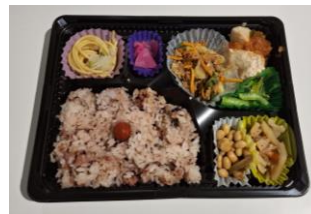
↑ 健康に配慮したお弁当